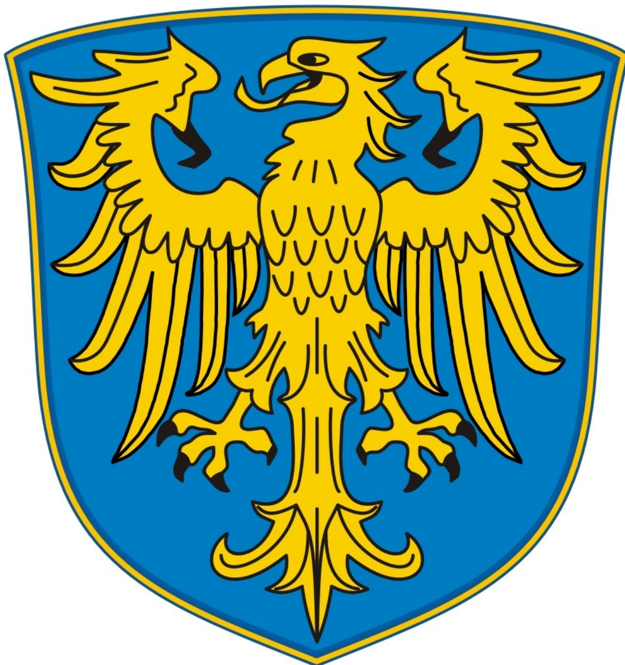
Załącznik nr 3. Wzór godła Regionu Autonomicznego Górny Śląsk